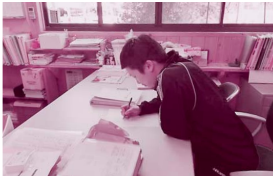
アンケートに回答中。ポーンズアップしてほしい!!