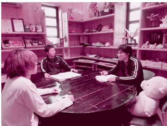
小会議。要求書のわかりにくいところを説明しています。