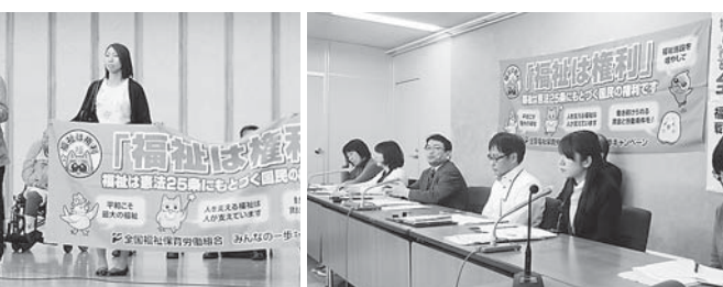
憲法25条を守る5・18共同集会で、政府の「我事・丸ごと」地域共生社会による動きを批判

るか、活動の見直しをするため、職場の内外の未加入者に自信をもって福祉保育労の存在と運動を伝えたい。都道府県をまたがる「広域地方本部の設置」について、必要に応じて中央役員によるオルグもおこなう、各地方組織で合意形成を図り、地方協議会の立ち上げに向けて具体的なとりくみをすすめます。