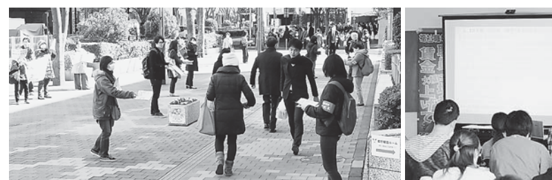
3・16全国いっせい行動 東京地本のなかま50人以上が都庁前で早期宣伝

るか、活動の見直しをするため、職場の内外の未加入者に自信をもって福祉保育労の存在と運動を伝えたい。都道府県をまたがる「広域地方本部の設置」について、必要に応じて中央役員によるオルグもおこなう、各地方組織で合意形成を図り、地方協議会の立ち上げに向けて具体的なとりくみをすすめます。