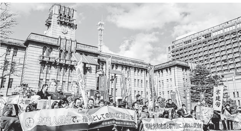
3・16全国いっせい行動 京都市役所前集会には他の多くの組合からも参加・激励が