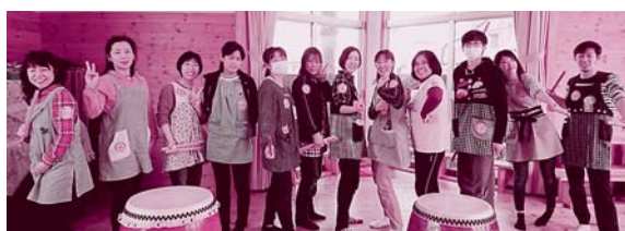
石川のなかまも3・16全国いっせい行動で団結

大幅増員・賃金改善請願 紹介議員は超党派に 昨年10月からは「福祉職員の大幅増員・賃金改善」国会請願署名をスタートさせ、国会会期末までに8万筆をこえる到達となりました。採択には至りませんが、要請行動の結果、衆議院と参議院の厚生労働委員を