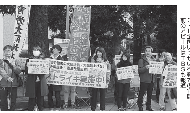
3・16全国いっせい行動での官邸前のアピールはTBSも報道