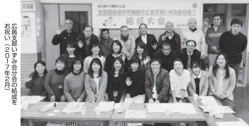
広島支部いっせい分会の結成を お祝い(2017年2月)