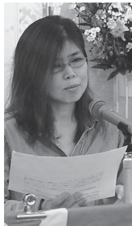
30回も支部役員が分会会議に入 って、いっせい行動へ(滋賀)

いとは何なのか、討議を大切に、ストに入っても入らなくても不団結を生まないようにと論議を重ねて当日を迎えた。職場462人が参加した「ストを告ぐ」、16全国いっせい行動に確信を深めた発言が相次ぎました。