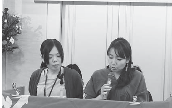
被害者の話を直接聞いた平和集会も報告(広島)

歴史的といえる核兵器 禁止条約が国連で採択さ れたなか、「8月5日に 中西四ブロック主催で平 和集会を開き、少なくな っていても被害者の話を直 接聞くことができた。来 年も多くの人に参加して もらいたい」(広島) と、「平和こそ最大の福 祉」を掲げるとりくみの 発言に大きな拍手がで ました。