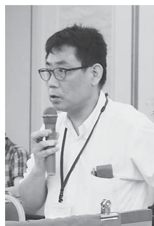
論議を重ねてストを打った 分会の報告も(神奈川県)

「ストまでして訴えた」 丁寧に討議を重ね行動に反響広がる 「ストまでして訴えた」 未加入者にも行動がある この参加をきっかけに、よくかけた。変えるため