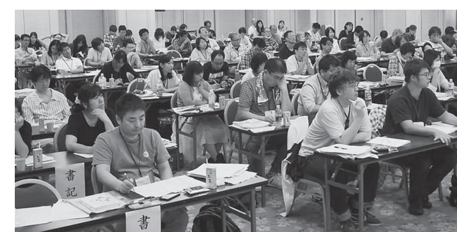
「いっせい行動」にかかわる討議に聞き入る出席者

ど、報告が続きました。「そんなの無理」変わった私たち スト権の受けとめをめぐっては、島根支部から「昨年の大会では『そんなの無理、誰が賛同するんだ』など否定的にとらえたが、討議・学習を踏まえて、意義を考え、仲間と共有し、周囲に示すことが大切だ」と気づいた。いっせい行動には間に合わなかったが、全組合員の批准投票で4月にスト権を確立した。新たに配置する専従者とスト