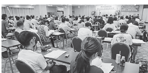
組合のない職場の職員と相談や 懇談を続けて(島根)

全国でたかっている 7つの争論の報告をう け、会場で集めた万言 を贈りました。不当処分 撤回、パワハラ謝罪を求 めた東京高裁での控訴審 のたかひについて、東 京地本・多摩同院分会の 竹高代議員からは、全 国の福祉労働者の命運を かけて最後の最後まで たかひぬ、「万強い決 意が表明されました」