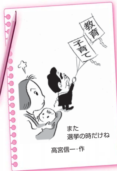
また選挙の時だけね 高宮信一・作