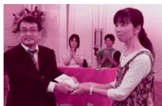
争議をたたかうなごまにカンパを贈呈