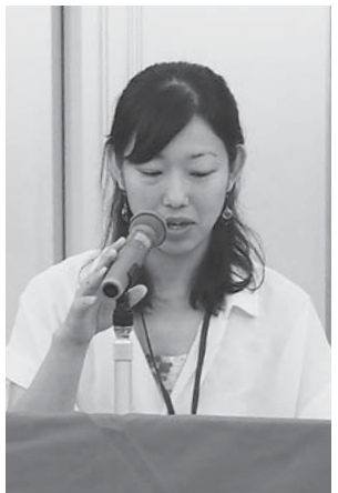
困難な職場の改善を求めて 自治体交渉も(東海)

改善策で矛盾が 協議し改善求めて 国の処遇改善策、特に 保育の処遇改善加算に 批判が相次ぎました。格 差が大きくなるしくみだ が一時金の調整でバラ ンスをとったが問題のあ る加算だ(秋田)「私 は4万引き上げの対象 になったが、1〜3年目 の若い職員の改善額はわ ずかだ格差が生まれてい る(宮城)「格差で分 断が生じかねない。全産 業平均と大きな格差あ ることは明白。なり手が 少ないが、底上げの施 策を求め現場の声を市 や県、国にあびたい」