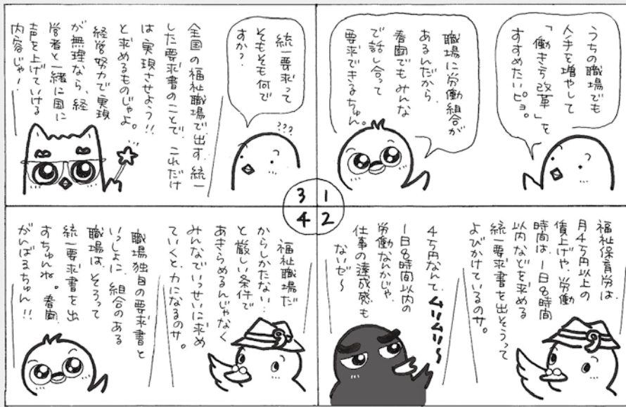
福志良先生は、毎月4万円以上の賃上げを要求し、労働時間は1日の労働時間以内を8時間以内にとりくむことを目指しています。