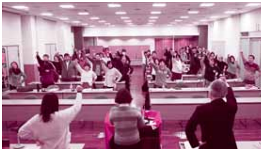
第54回中央委員会（2018年1月21日）で春闘方針を採択