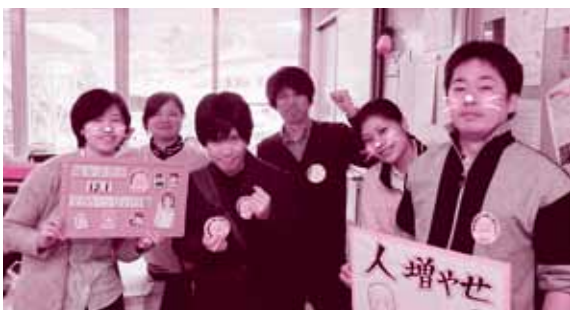
12・1全国いっせい行動 京都地本・こぶしの里分会は各介護事業所で写真を撮ってツイッターにもアップ!