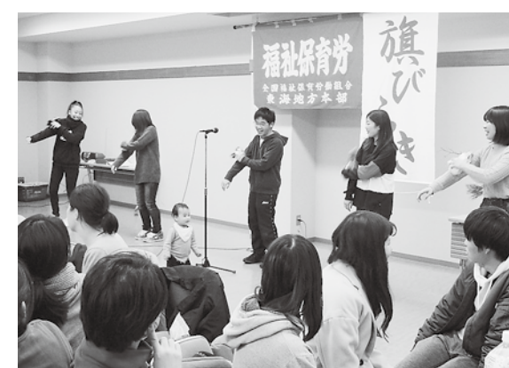
東海地本2018年旗開きで分会のみんなが勢ぞろいして出し物

組合に加入したとの発言や、終わった後は「労働組合だから言ってもいいんだ」などの感想も出されました。 10月にも要求書を提出し、今年1月に団交を実施。「子どものためなら何でもする」と言いながら、自分の働き方を自分で良くしようという気持ちは、結局「子どものため」にならないのは、分会員の発言です。働き続けられる職場をめざしてがんばっていきます。