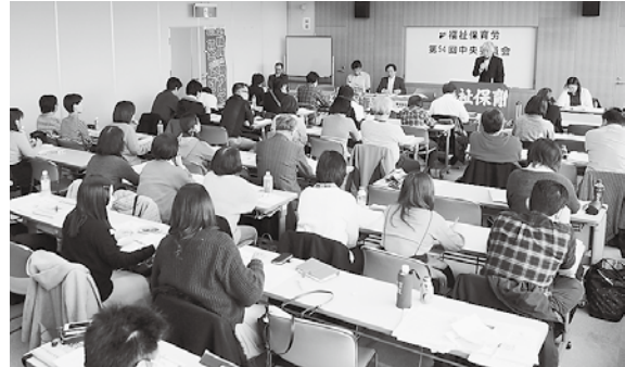
会議では31人が討論して方針を決定しました

組織の拡大では、「この秋に介護施設で2つの分会を結成できた。労働相談や団体交渉などに他の施設の役員も支援して組合員が増えた」(東京)、「組合のない職場で働く若い職員