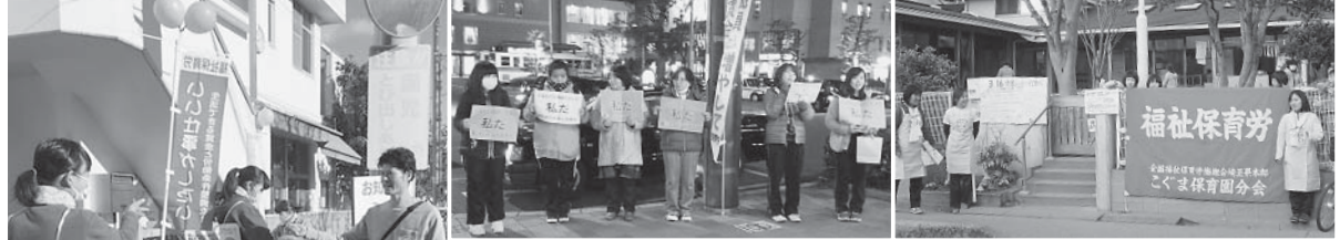
2017.3.16 滋賀支部 駅頭宣伝 2017.3.16 埼玉県本部・こくま保育園分會

昨春の経験や教訓を踏まえ、各地で協議がすすみ、静岡地中や鳥根支部で新たにスト権が確立されるなど、今春闘を迎えています。「1日の労働時間は8時間以内、休憩時間も確保する」といふ確信を持って、「働き方の見直し」をおこない、経営者に法令遵守を約束せよと、国に対しては、要求項目の実現が可能な報酬や法定価格の引き上げを求めています。春闘期すべての運動