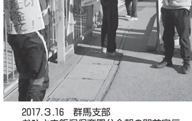
2017.3.16 群馬支部 おひさま飯塚保育園分會朝の門前宣伝

中央本部として3月7日の厚労省との役員交渉で納得できる回答が得られなければ、スト権を確立した地方組織で3月15日にストに入ることを伝えます。