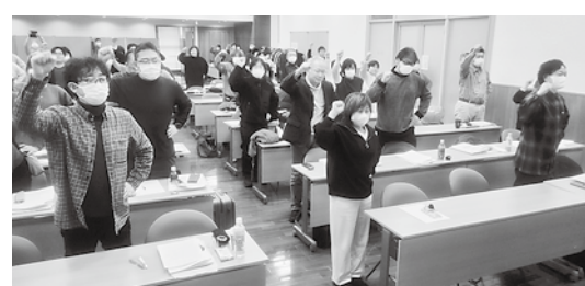
会場の出席者で春闘アピールを採択して決意を固めました

1月11・12日、第61回中央委員会を東京都内で開催し、中央委員32人と中央役員など計54人が出席しました。統一要求を含めた25春闘方針（案）と2025年度中央委員の選出基準（案）の提案と討論のあと、議案をそれぞれ採択しました。11日は討論のあとに休会し、12日のグループに分かれて、グループ討論をおこないました。昨年は「賃金足りてる？」「休みとれてる？」ホンネのトーク会をすすめてきました。その意見シートのまとめとWebアンケートの結果を踏まえて、グループでは「社会的基準づくり運動のゴール設定とゴールへの道筋」をテーマに、意見を出しあいました。