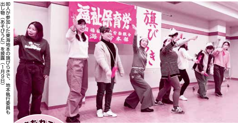
80人が参加した東海地域の旗びるなごま、地本執行委員も出し物(あそび)を披露(1月の日)

労働組合が持っている団結権・団体交渉権・団体行動権をフル活用して、経営者の雇用責任を追究して、要求実現を迫ります。団体交渉を法人は拒否できません。納得がいかなければ継続して協議します。ストライキを構えて法人に譲歩を迫ることも戦術のひとつです。